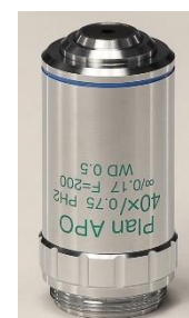
プランアポクロマート 対物レンズ 40X