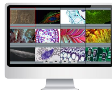
[ アルバム表示 ]