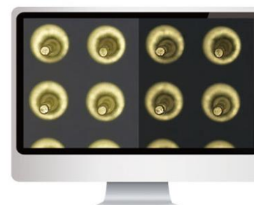
[ 2 画面比較 ]